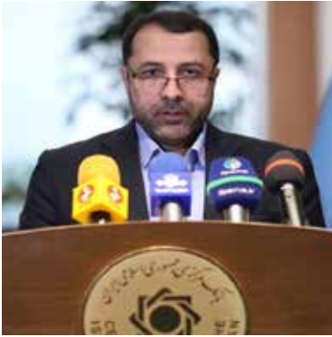
سیدرضا فاطمی‌امین وزیر صنعت، معدن و تجارت در مورد واردات خودرو می‌گوید: «در شرایط کنونی با توجه به این که تولید خودرو بسیار کمتر از تقاضای بازار است، واردات برای تنظیم و کنترل بازار آزاد خودرو ضروری است. در آیین‌نامه پیشنهادی واردات خودرو به انتقال فناوری برای بهبود کیفیت صنعت خودرو توجه ویژه‌ای شده است. همچنین یکی از ویژگی‌های آیین‌نامه جدید واردات خودرو، توجه به واردات خودروهای اقتصادی بوده و رویکرد ما تامین خودروی قشر کمتر برخوردار جامعه در سبد محصولات خودرویی است.»

ساداتی افزود: در حال حاضر کارگران ساختمانی را به سمت بیمه سلامت سوق می‌دهند و اعلام می‌شود که در مان رایگان دارد. ممکن است در تهران بیمه رایگان برقرار باشد ولی در شهرستان‌ها فاقد در مان است و جدا از بحث در مان، باید از کار افتادگی و فوت راهم در مورد کارگران ساختمانی پیش‌بینی کنیم. به گفته وی، در حال حاضر کارگران ساختمانی جزو مشاغل و حرفه آزاد هستند و بیمه آنها به صورت خویش فرمایی (اختیاری) است که ۷۰ درصد حق بیمه را پرداخت می‌کنند و بقیه منابع در یک صندوق جمع می‌شود تا همه کارگران از آن بهره‌مند شوند.