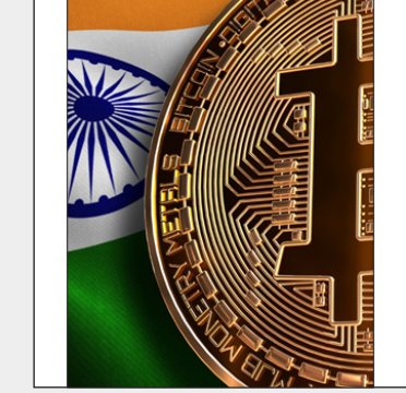
تهیه و ترجمه : غزل حیدری