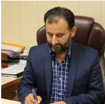
رئیس اتحادیه مسراسری کلان‌های کلان‌های دادگستری ایران (اسکودا) گفت: از یک طرف گفته می‌شود مردم در باب داوری دخالت نکنند، یعنی مردم در امور خودشان مشارکت داشته باشند، اما از آن طرف شاهد شکل گیری یک دستگاه عریض و طویل قضایی در کشور هستیم.