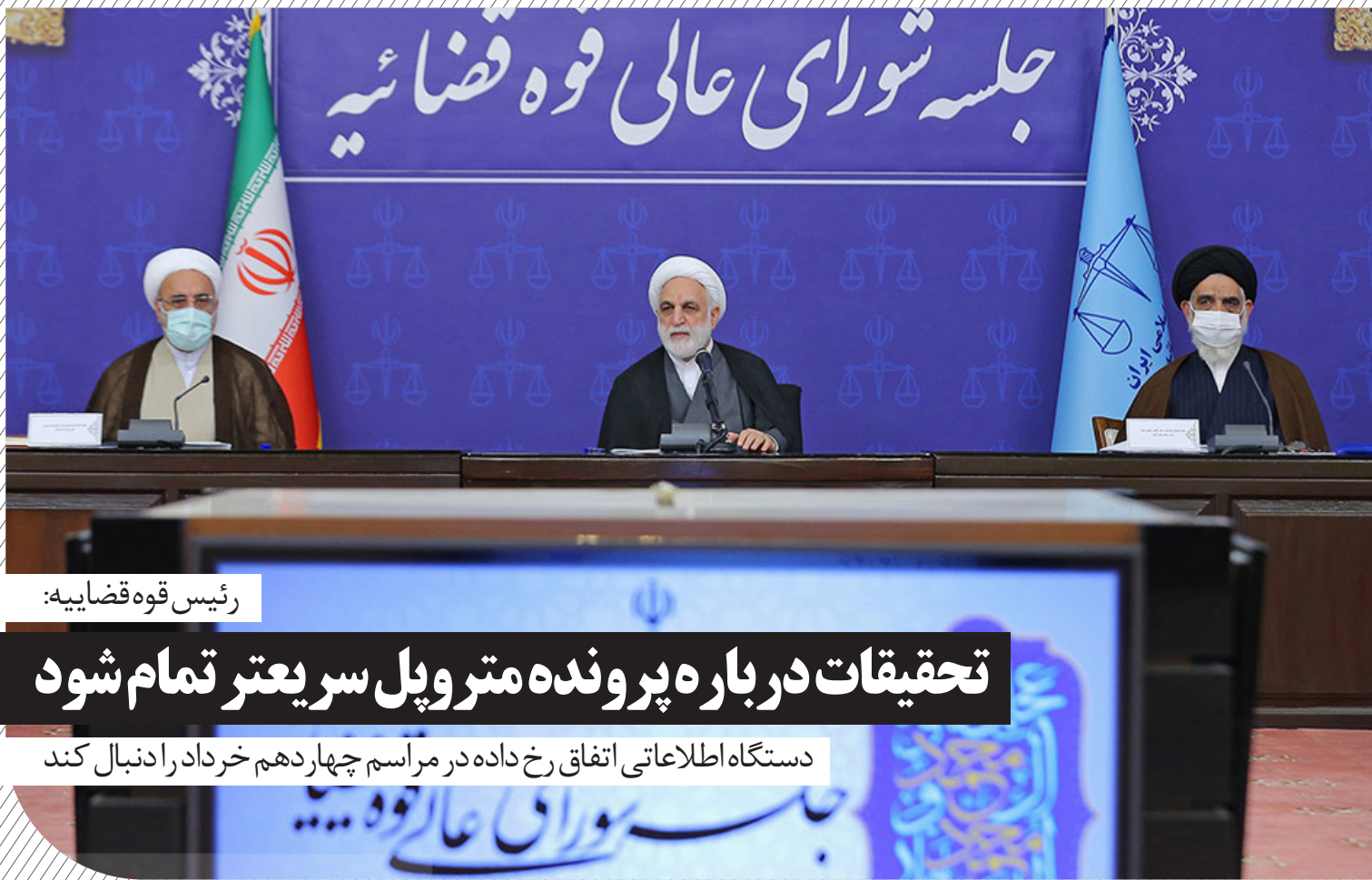
رئیس قوه قضاییه: