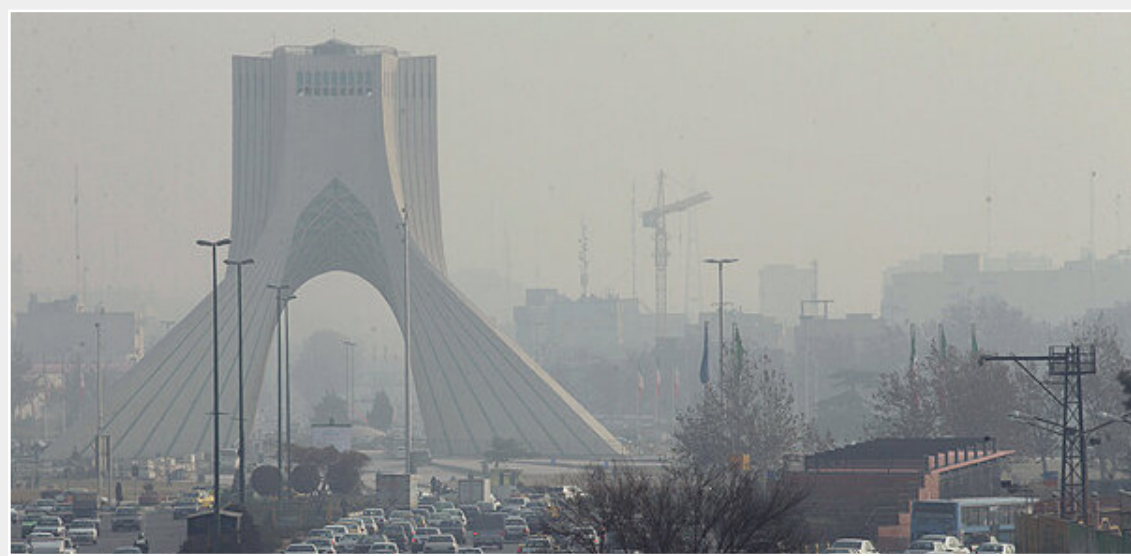
در جمع خبرنگاران مطرح شد: ۷۰ درصد ایران درگیر ورشکستگی آبی است

عضو مجمع تشخیص مصلحت نظام گفت: نامزدهایی که در مناظره انتخاباتی دروغ و تهمت زدند و توهین کردند، باید از مردم عذرخواهی کنند چرا که رفتارشان بزرگترین خیانت به مردم است.